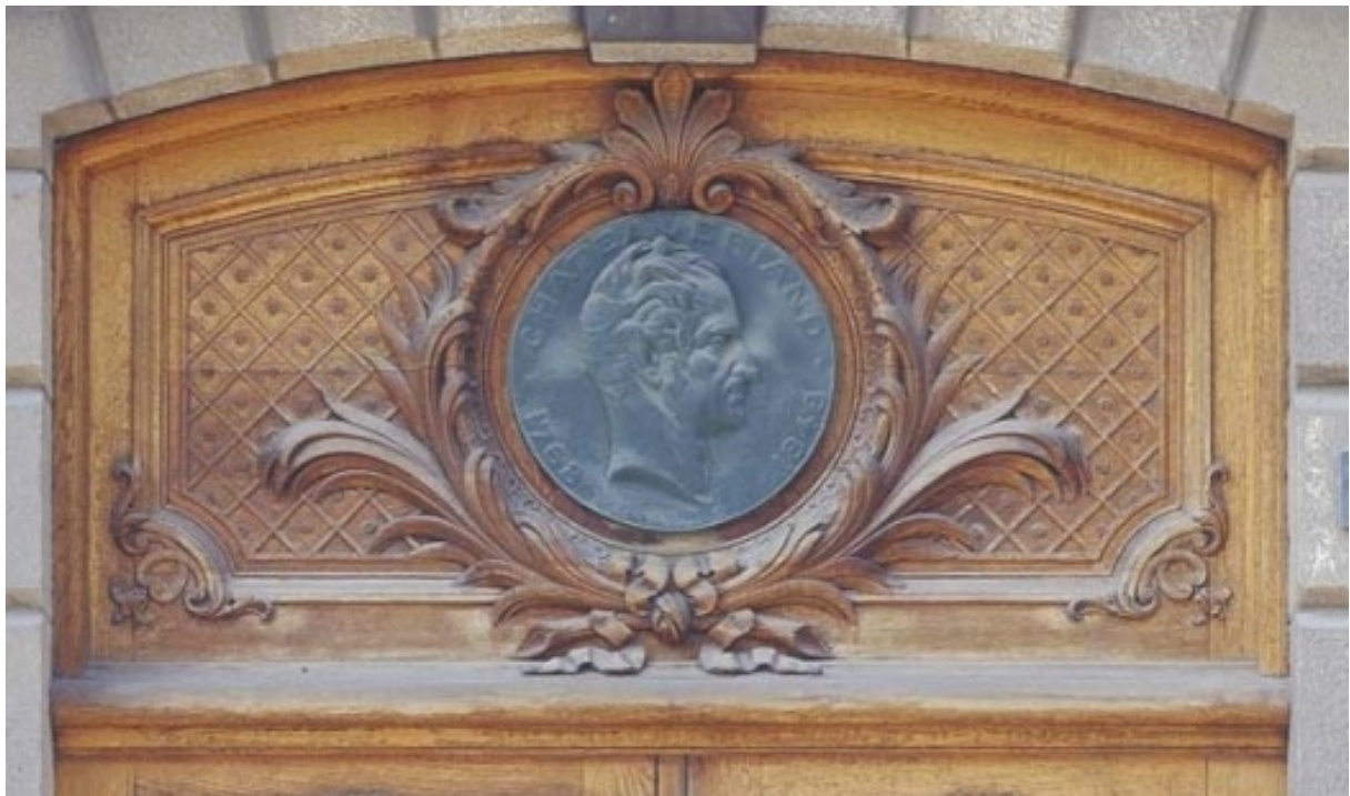
Hôtel White (médaillon) 2, place Chateaubriand, Saint-Malo

Doté d'une belle fortune, il fit construire en 1711 un hôtel particulier lors du premier accroissement de Saint-Malo face à la porte Saint-Vincent. Il s'agissait d'une bâtisse de trois à façade de pierre de taille. L'armateur René-Auguste de Chateaubriand, père du futur écrivain, y a habité avec sa famille. Au second étage demeurait la famille Gesril du Papeu, dont le fils Joseph, dit « Joson », devient le turbulent compagnon d'enfance du jeune Chateaubriand. En 1776, un incendie oblige les Chateaubriand à regagner leur ancienne maison de la rue des Juifs. L'immeuble a été presque totalement détruit en août 1944. Il n'en reste plus que les deux colonnes de l'entrée et la façade latérale sur la rue Garengéau. Les façades ont été scrupuleusement reconstituées à l'identique.